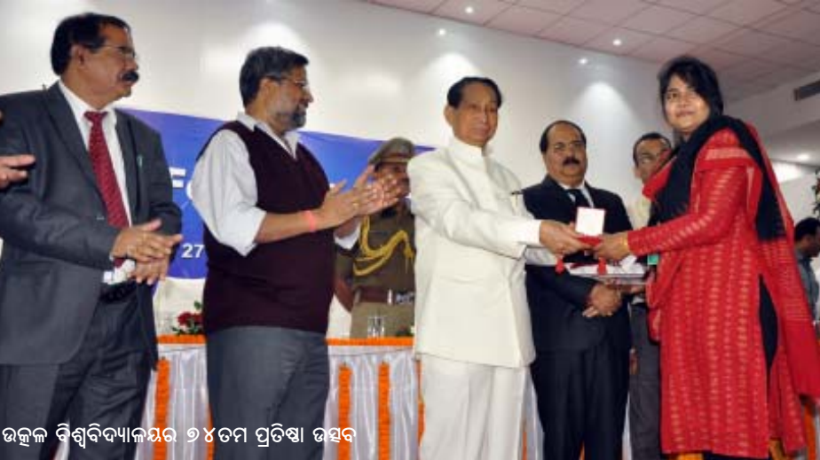
ଉତ୍କଳ ବିଶ୍ୱବିଦ୍ୟାଳୟର ୭୪ତମ ପ୍ରତିଷ୍ଠା ଦିବସ

ରାଜନୀତି ବିଜ୍ଞାନ ବିଭାଗରୁ ପ୍ରାଚୀନ ଇତିହାସ ଓ ଲୋକ ପ୍ରଶାସନ ପାଠ୍ୟକ୍ରମକୁ ଅଲଗା କରାଯାଇ ସ୍ୱତନ୍ତ୍ର ବିଭାଗ ପ୍ରତିଷ୍ଠା କରାଗଲା । ୨୦୦୦ ମସିହାରେ ଏଠାରେ କେନ୍ଦ୍ର ସରକାରଙ୍କ ବାୟୋଟେକ୍ନୋଲୋଜି ବିଭାଗ ସହାୟତାରେ ସ୍ନାତକୋତ୍ତର ପାଠ୍ୟକ୍ରମ ଖୋଲାଯାଇଛି । ଚଳିତ ଦଶନ୍ଧି ପ୍ରଥମାର୍ଦ୍ଧରେ ଏଠାରେ ଯୁକ୍ତିସି ସହାୟତାରେ ସାମାଜିକତା, ପର୍ଯ୍ୟଟନ ଓ ଯୋଗ ଆଦି ସ୍ୱତନ୍ତ୍ର ପାଠ୍ୟକ୍ରମ ଖୋଲାଯାଇଥିବାବେଳେ ଘରୋଇ ଭାଗିଦାରି ସହାୟତା(ପିପିମୋଡ଼)ରେ କୃଷି ବ୍ୟବସାୟ ପରିଚାଳନା ଏବଂ ଆଇଟିରେ ଏମ୍ପ୍ଲୋୟମେଣ୍ଟ ଆଦି ପାଠ୍ୟକ୍ରମ ପ୍ରଚଳିତ ହୋଇଛି । ସାମଗ୍ରିକ ଭାବରେ ୨୭ଟି ସ୍ନାତକୋତ୍ତର ବିଭାଗ, ୧୭ଟି ସ୍ନାତକମତା ପାଠ୍ୟକ୍ରମ, ୩୫୧ଟି ଅନୁବନ୍ଧିତ ମହାବିଦ୍ୟାଳୟ, ୧୫ଟି ସ୍ୱୟଂଶାସିତ ମହାବିଦ୍ୟାଳୟ ଇତ୍ୟାଦିରେ ସ୍ନାତକ, ସ୍ନାତକୋତ୍ତର, ଅଧିସ୍ନାତକ ଓ ବିଭିନ୍ନ ପାଠ୍ୟକ୍ରମ ମାଧ୍ୟମରେ ଓଡ଼ିଶା ତଥା ଭାରତ ବର୍ଷର ଶିକ୍ଷା କ୍ଷେତ୍ରରେ ଏହି ମହାନ ଅନୁଷ୍ଠାନ ନିଜସ୍ୱ ପରଚୟ ସୃଷ୍ଟି କରିଛି । ଉନ୍ନତ ଭିତ୍ତିଭୂମି, ଗୁଣାତ୍ମକମାନର ଶିକ୍ଷାଦାନ ପ୍ରଣାଳୀ ଓ ଗବେଷଣାକୁ ଆଧାର କରି ଉତ୍କଳ ବିଶ୍ୱବିଦ୍ୟାଳୟକୁ ସର୍ବଭାରତୀୟସ୍ତରରେ ମିଳିଛି ନାକ ଏ+ ମାନ୍ୟତା । ସର୍ବୋପରି ନିଜର ସୃଷ୍ଟି, ପ୍ରତିଷ୍ଠିତ ପ୍ରାକ୍ତନ ଛାତ୍ରମଣ୍ଡଳୀ, ସ୍ୱତନ୍ତ୍ର ଦୃଢ଼ ନେତୃତ୍ୱ ଯୋଗୁଁ ପ୍ରତିଷ୍ଠିତ ପରମ୍ପରା ଓ ପରିଚାଳନା ବ୍ୟବସ୍ଥା, ଅଜ୍ଞାନୀକରଣ ପରିବାରର ସଦସ୍ୟ ୧୯୯୯ ମସିହାରୁ ସ୍ୱାବଲମ୍ବୀ ପାଠ୍ୟକ୍ରମ ଯଥା ପାଞ୍ଚ ବର୍ଷିଆ ବ୍ୟବସାୟ ପରିଚାଳନା(ଆଇଏମ୍‌ବିଏ), କମ୍ପ୍ୟୁଟର ବିଜ୍ଞାନ (ଆଇଏମ୍‌ସିଏ), ଆଇନ(ଇଣ୍ଟିଗ୍ରେଟେଡ୍ ଲ'), ଫାର୍ମାସିଟିକାଲ୍ ସାଇନ୍ସ ଆଦି ପାଠ୍ୟକ୍ରମମାନ ଖୋଲାଯାଇ ସ୍ନାତକୋତ୍ତର ଓ ସ୍ନାତକ ପାଠ୍ୟକ୍ରମ ପ୍ରଚଳିତ ହୋଇଛି । ୧୯୯୬ ମସିହାରେ ଏଠାରେ ଇତିହାସ ଓ