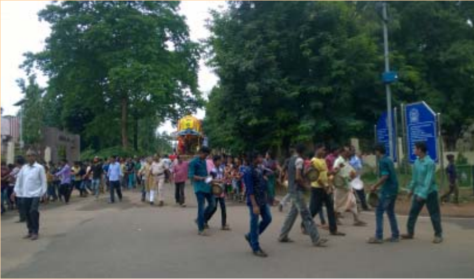
ବିଶ୍ୱବିଦ୍ୟାଳୟରେ ୧୯୭୩ରୁ ସମ୍ପନ୍ନ ହେଉଛି। ପବିତ୍ର ଅକ୍ଷୟ ତୃତୀୟା ଶ୍ରୀଜଗନ୍ନାଥଙ୍କ ଘୋଷଯାତ୍ରା ତିଥିରୁ ରଥ ଅନୁକୂଳ ହୁଏ। ହୋଇଆସୁଅଛି। ବିଶ୍ୱେଶ୍ୱର ମନ୍ଦିରରୁ ସ୍ନାନପୂର୍ଣ୍ଣମାରେ ଚତୁର୍ଦ୍ଧାମୂର୍ତ୍ତି ସ୍ନାନ ପରେ କେଦାରେଶ୍ୱର ମନ୍ଦିର ପର୍ଯ୍ୟନ୍ତ ଅଣସର ଘରେ ରୁହନ୍ତି। ଆଷାଢ଼ ଶୁକ୍ଳ

ରଥରେ ଚତୁର୍ଦ୍ଧାମୂର୍ତ୍ତି ବିରାଜମାନ ପରେ ବିଶ୍ୱେଶ୍ୱର ମନ୍ଦିରରୁ ଆରମ୍ଭ ହୋଇଥିଲା ରଥଟୋ। ଭାବ ଓ ଭକ୍ତିମୟ ପରିବେଶରେ ଶ୍ରୀଜୀଉଙ୍କ ରଥକୁ ଟାଣିଥିଲେ ଶ୍ରଦ୍ଧାଳୁ। ଯୁନିଭର୍ସିଟି ହାଲସ୍କୁଲ ପଛପାର୍ଶ୍ୱ ଦେଇ ପାଣିଚାକି, କୁଳପତିଙ୍କ କାର୍ଯ୍ୟାଳୟ, ପିଜି କାଉନ୍ସିଲ କାର୍ଯ୍ୟାଳୟ, ସ୍କୁଲ ଅଫ୍ ଫ୍ଲୋରୀ ଷଡିଙ୍ଗ, ଏନିଏ, ମାଧ୍ୟମିକ, ଆଇଏମ୍‌ସିଏ, ଫାର୍ମାସି ବିଭାଗ ରାସ୍ତାରେ ଡାହାଣମୋଡ଼ ନେଇଥିଲା। ସାଫ୍ କ୍ୱାର୍ଟର ଅଭିମୁଖେ ଯାଇଥିବା ରାସ୍ତାରେ ଯାଇ ମହାପ୍ରଭୁଙ୍କ ରଥ ପହଞ୍ଚିଥିଲା ମାଉସୀମା ମନ୍ଦିରରେ।