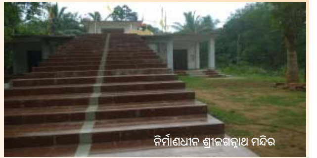
ନିର୍ମାଣଧାର ଶ୍ରୀଜଗନ୍ନାଥ ମନ୍ଦିର

୨୦୧୬ରେ ଅରୁଣସ୍ତମ୍ଭ ଓ ଗରୁଡ଼ସ୍ତମ୍ଭ ମନ୍ଦିର ପରିଚାଳନା ସମିତି ପକ୍ଷରୁ ସାଙ୍ଗକୁ ୨୨ପାହାର ନିର୍ମାଣ କାର୍ଯ୍ୟ ବାଣୀକ୍ଷେତ୍ରରେ ରଥଯାତ୍ରା ସମ୍ପନ୍ନ